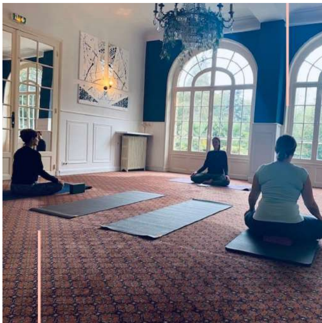
Studio Ohm Fusion au Moulin d'Orgeval (Paris Ouest 78), chez notre partenaire

• Introduire un atelier yoga lors de votre événement professionnel ou proposer des cours de yoga en entreprise , c'est donner de l'importance à la santé mentale, physique et émotionnelle ainsi qu'au bien-être en général de vos salariés